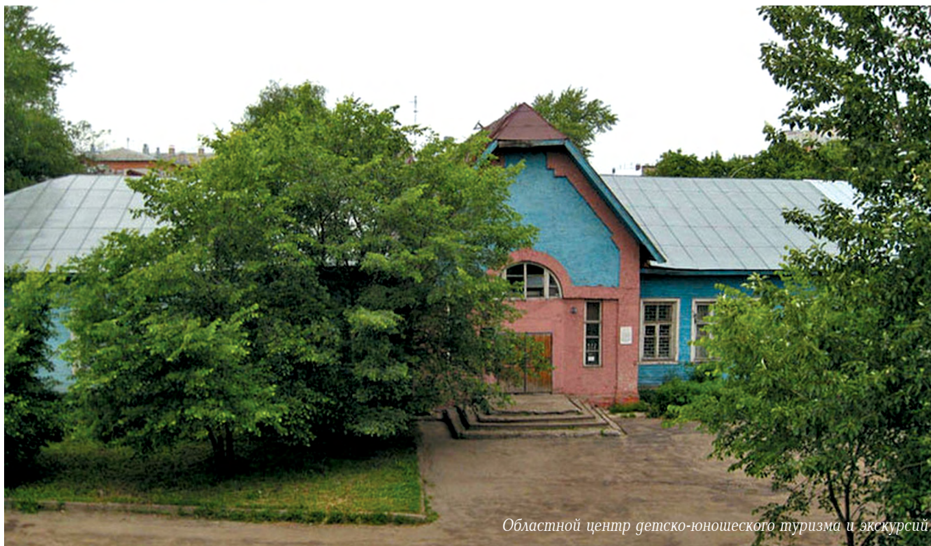
Областной центр детско-юношеского туризма и экскурсий